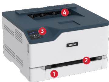
Xerox® C230 Farbdrucker