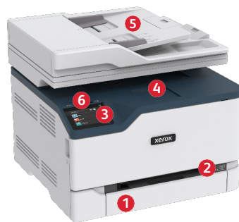
Xerox® C235 Multifunktions-Farbdrucker