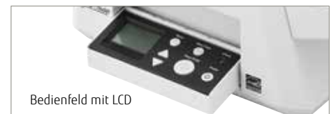
Bedienfeld mit LCD

Der fi-7600 verfügt auf beiden Seiten über ein Bedienfeld. Somit kann der Scanner für rechts- und linkshändigen Einsatz aufgestellt werden. Das im Bedienfeld integrierte LCD zeigt auf einen Blick den Gerätestatus an und ermöglicht die Auslösung von Erfassungsroutinen auf Knopfdruck.