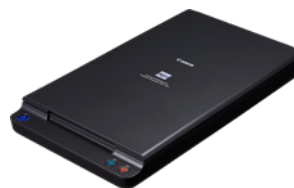
DIN A4-Flachbett-Scaneinheit 102

Scannen Sie Bücher, Zeitschriften und empfindliche Medien mit der optionalen Flachbett-Scaneinheit 102 (bis DIN A4) oder der Flachbett-Scaneinheit 201 (bis DIN A3). Einfach per USB angeschlossen, arbeiten diese Flachbettscanner nahtlos mit der DR-G Serie zusammen und ermöglichen die Anwendung aller verfügbaren Funktionen zur Bildverbesserung.